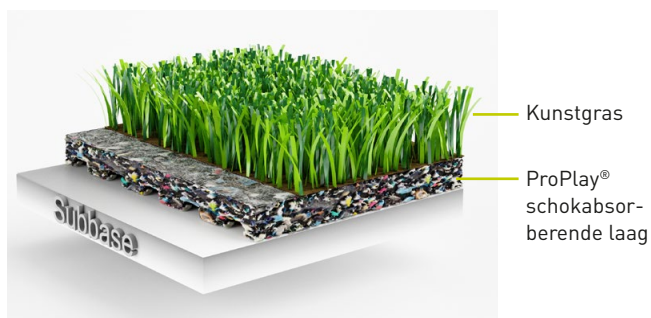
Kunstgrassysteem met ProPlay ® -Sport schokabsorberende laag