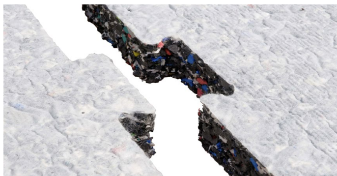
Sous-couche Proplay amortissante avec queues d'arrondées du Proplay pour aires de jeux