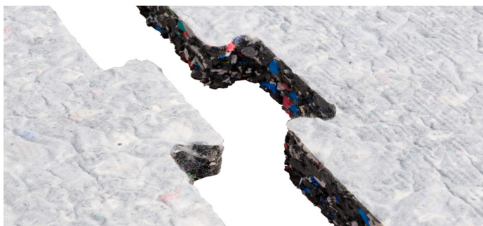
Feuilles ProPlay ® taillées en pièces de puzzle