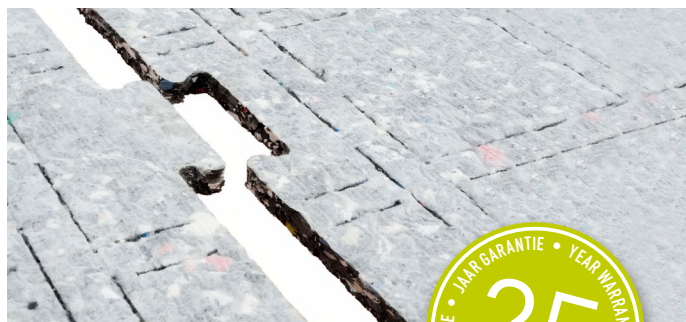
Feuilles ProPlay ® taillées en pièces de puzzle avec encoches d'extension