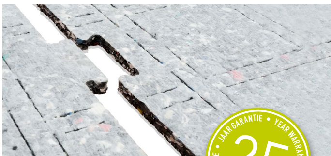
Feuilles ProPlay ® taillées en pièces de puzzle avec encoches d'extension