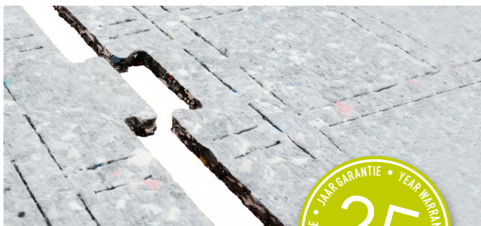
Feuilles ProPlay ® taillées en pièces de puzzle avec encoches d'extension